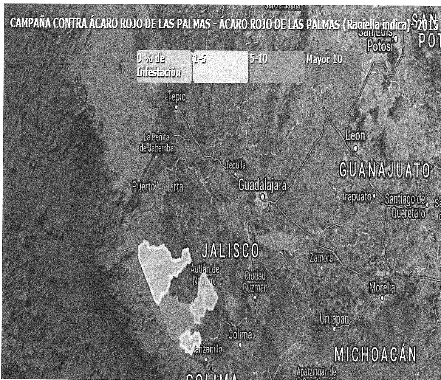
Figura 1. Estatus fitosanitario del Ácaro Rojo de las Palmas, en el estado de Jalisco. Mapa de seguimiento del 2015.

Durante el año 2015, se muestrearon 2,724.57 hectáreas, en los municipios de Puerto Vallarta, Cabo Corrientes, Tomatlán, La Huerta, Cihuatlán y Casimiro Castillo.