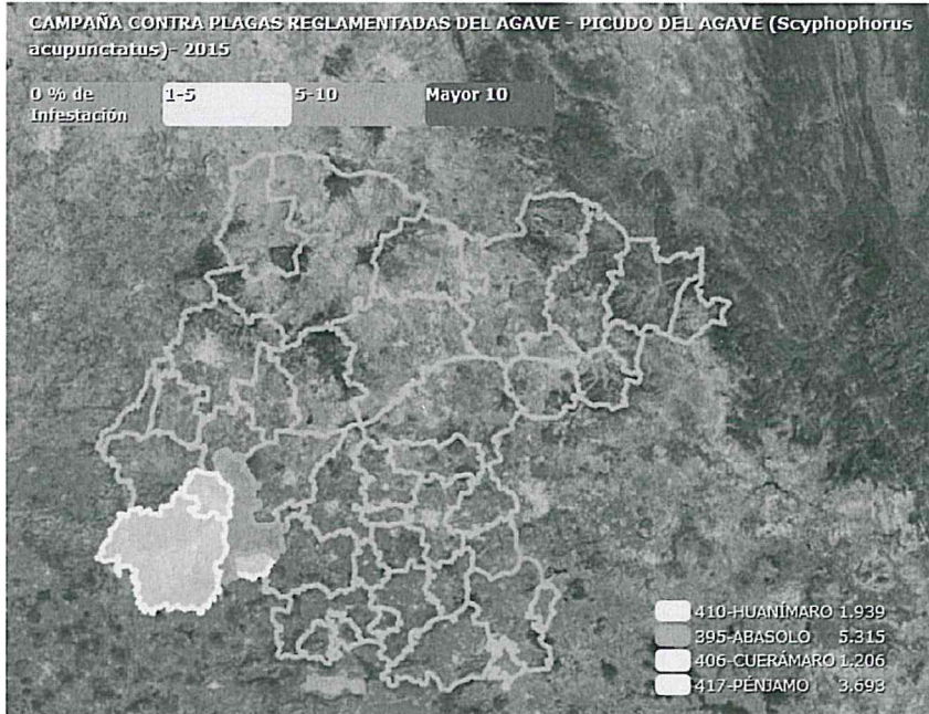
Infestación del picudo en 4 municipios con Denominación de Origen Tequila en Guanajuato (SICAFI, 2015).

Durante los muestreos realizados en las plantaciones de agave azul en los municipios Abasolo, Cuernavaca, Huanimaro y Pénjamo, se determinó la presencia y porcentajes de infestación del picudo ( Scyphophorus acupunctatus ) en un rango del 10 al 20 % y en algunos predios el porcentaje superó el 20 % de infestación en plantas de agave azul. Los cuatro municipios son actualmente considerados como zona bajo control fitosanitario; sin embargo los daños en planta no son de consideración hasta el momento.