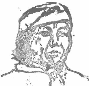
GOBERNADOR INDÍGENA DE LA COMUNIDAD DE TEMORIC MUNICIPIO DE TEMORIC