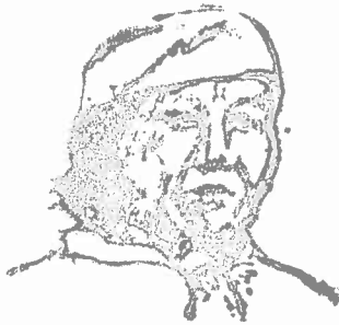
GOBERNADOR INDIGENA DE LA COMUNIDAD DE TEMOC MPIO. GUAZAPARE, CHIM.

El Registro de asistentes se anexa a la presente Acta y todos los anexos forman parte integral de la misma.