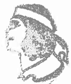
GOBERNADOR INDÍGENA MUNICIPIO DE GUAZAPARC