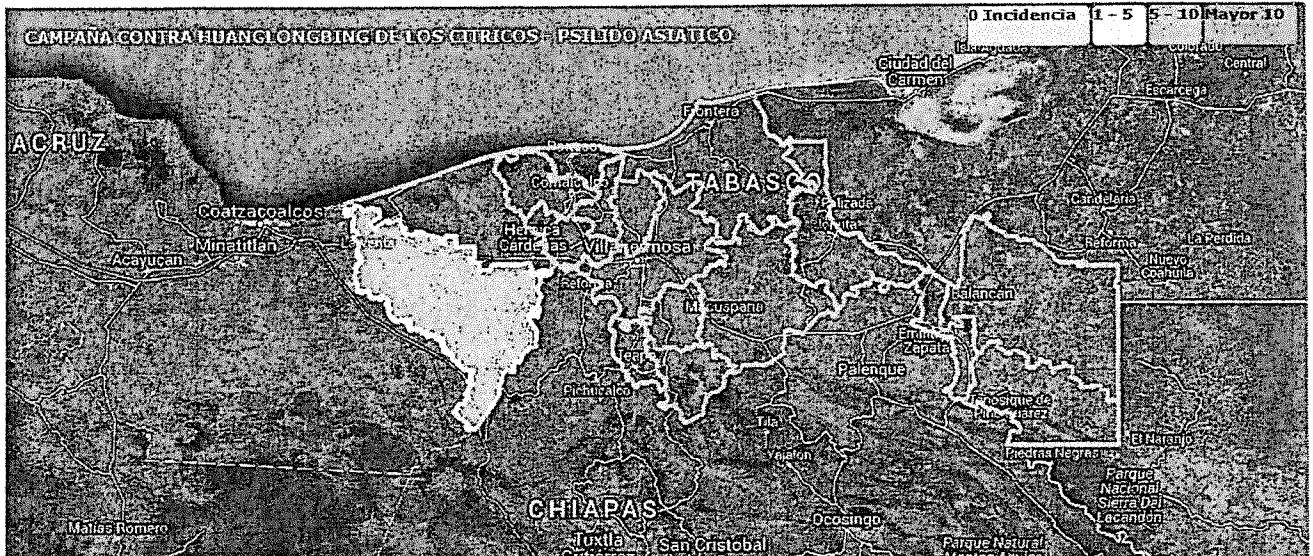
Figura. 1. Mapa de la Situación fitosanitaria que guarda la plaga en la entidad

Mediante el monitoreo del psílido asiático de los cítricos realizado en el Área Regional de Control (ARCO) operada durante el 2015 en el estado de Tabasco, se logró conocer la fluctuación poblacional del insecto a través del año, para lo cual se tuvo un nivel de infestación anual de 0.12 y en el mes de diciembre de 0.07. Además, permitió identificar huertas en donde hubo un incremento de la población del vector, en las cuales se realizó el control de dichos brotes en beneficio de toda la superficie bajo ARCO's (figura 1).