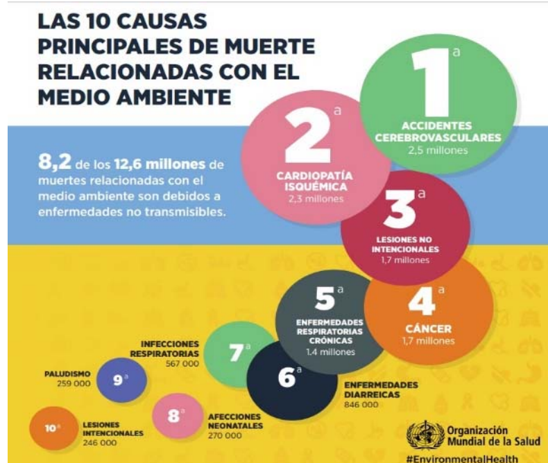
ILUSTRACIÓN 1.- LAS 10 CAUSAS PRINCIPALES DE MUERTE RELACIONADAS CON EL MEDIO AMBIENTE