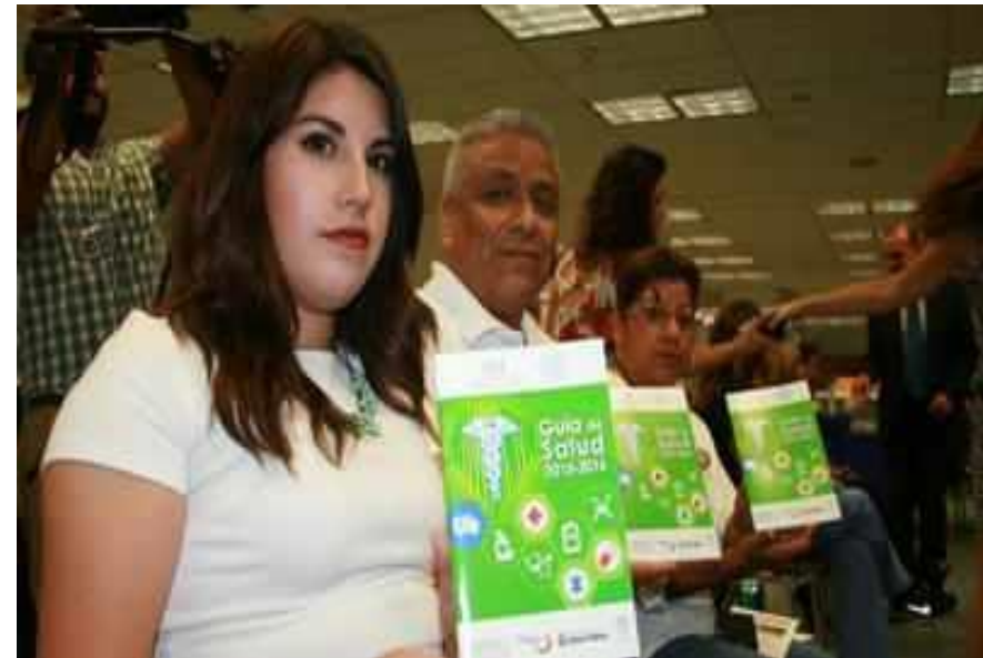
Asistentes de medios y público general.