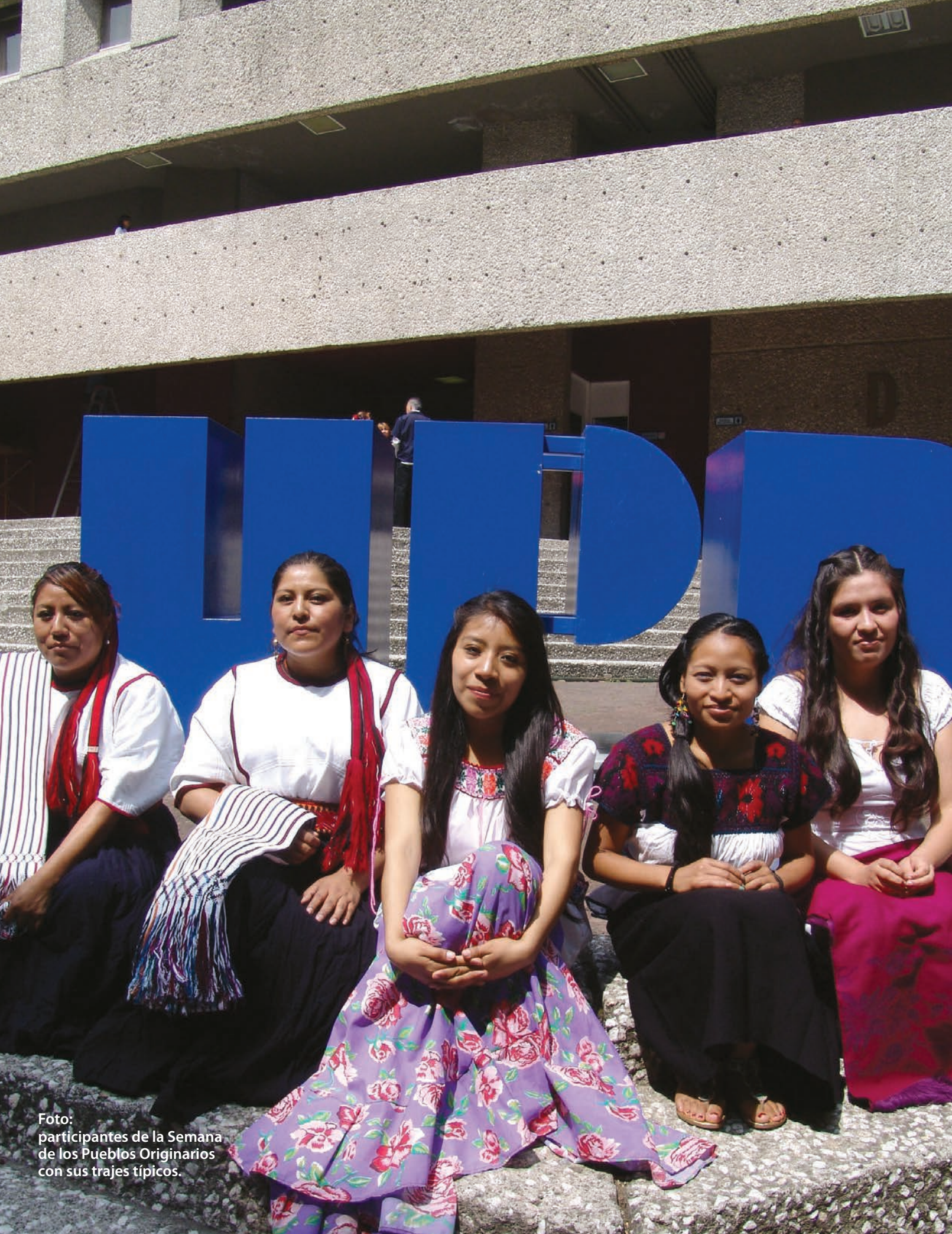
Foto: participantes de la Semana de los Pueblos Originarios con sus trajes típicos.