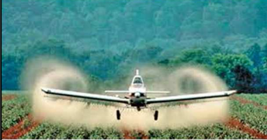
NOM-052-FITO-1995. Aplicación aérea de plaguicidas agrícolas.