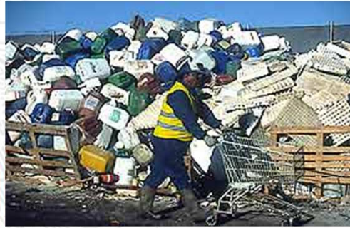
NOM-081-FITO-2001. Manejo y eliminación de focos de infestación de plagas agrícolas.

SEMARNAT SECRETARÍA DE MEDIO AMBIENTE Y ENERGÍA