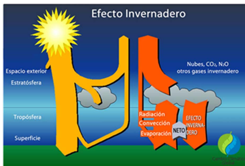
FIGURA 2. TOMADA DE: CAMBIO CLIMÁTICO GLOBAL. (2015). CAUSAS Y EFECTOS EN LA SALUD.

FUENTE: Online: http://cambioclimaticoglobal.com/