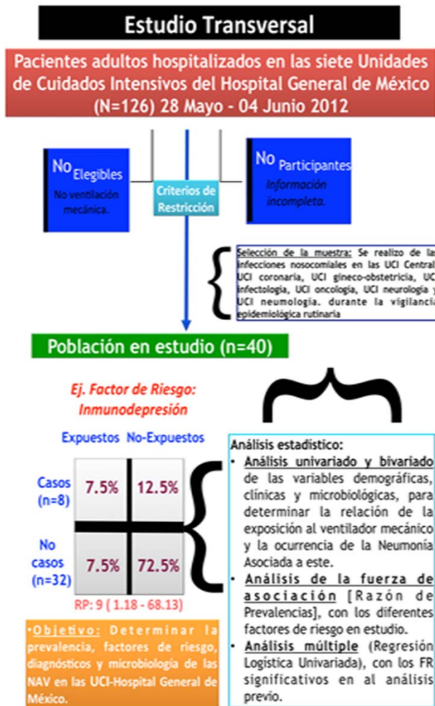
FIGURA I "RESUMEN METODOLÓGICO"

La recolección de información y las visitas a las UTI , se llevaron a cabo en el contexto del sistema de vigilancia epidemiológica de las infecciones asociadas a la atención de la salud, enfocándose en los pacientes con VMI . Se recolectó la información de los expedientes de todos los pacientes que cumplieran con los criterios de selección en el tiempo indicado, por medio de un instrumento especial para las NAV basado en los criterios de los CDC y emitido por estos mismos. Se realizó el análisis estadístico en el programa STATA 12.1, incluyendo la estadística descriptiva, análisis bivariado y multivariado. (Ver Figura I)