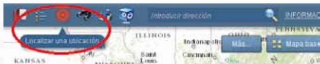
Imagen 4. Botón para localizar una ubicación

5. Se desplegará una ventana en la que se tendrán que ingresar las coordenadas convertidas, para posteriormente localizarlas en el mapa.