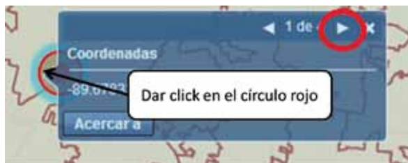
Imagen 8. Consulta del Acuífero