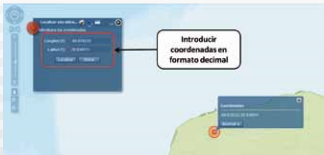
Imagen 5. Menú para localizar una ubicación

6. Una vez realizado lo anterior, deberá activar las opciones de “disponibilidad de acuíferos”, “estado” y “municipio” dando click en el botón “Más”.