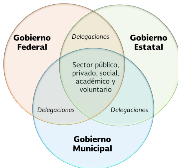
Figura 3. Conceptualización del Sistema Nacional de Protección Civil

Se analizó cada una de las Leyes de Protección Civil de cada Entidad Federativa, así como de algunos reglamentos municipales, (en forma representativa) con el objeto de verificar si efectivamente están homologadas y están acorde a las disposiciones que se señalan en la Ley General de Protección Civil, Ley General de Asentamientos Humanos (Federal) Así como sus constituciones políticas estatales