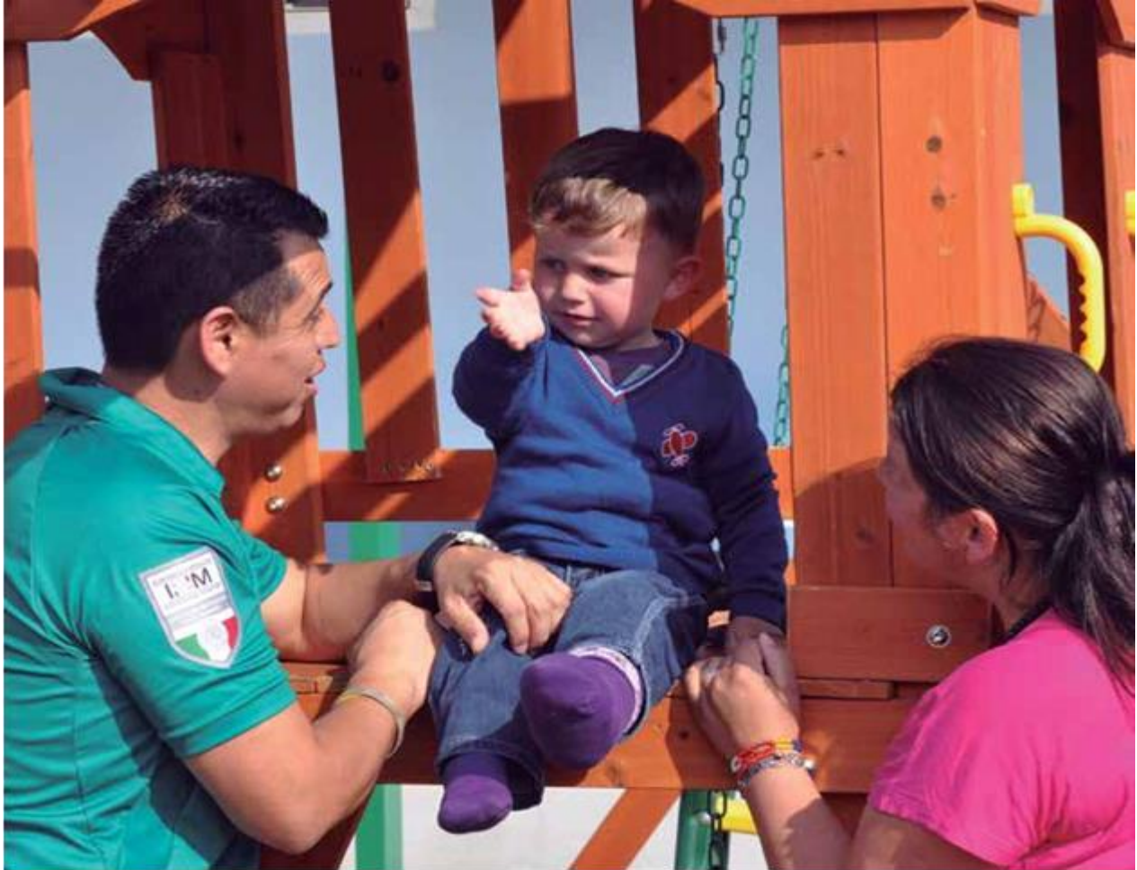
.Oficiales de Protección a la Infancia quienes se encargan de proteger y custodiar los derechos de las niñas, niños y adolescentes migrantes